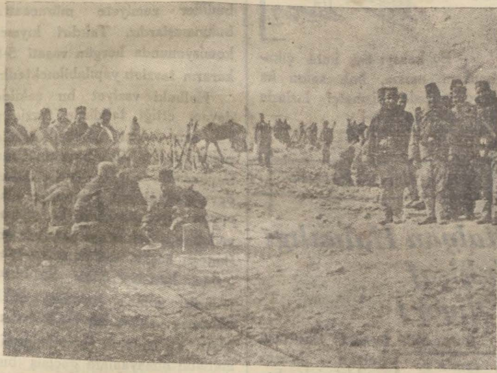
Mustafa Kemal Bey tarafından tensik edilen Derne kuvvetleri

Şimalî Afrika sahilinde top güremeleri duyulur duyulmaz, Makedonyada da bomba tarrakaları işitilmeye başlamıştı.. Bulgar komitecileri derhal harekete geçmişler; şimendifer hatlarını, köprüleri, karakolları tahribe girişmişlerdi. Bütün bunlar, Bulgarlar hakkında büyük bir hoşnutsuzluk tevliht etmekle beraber yine az çok bir sükunetle karşılanmıştı. Fakat bir cuma namazında (İstip) camisine konulan saatli bir bombanın patlaması.. On beş İslâmın ölümüne kırk üç kişinin de yaralanmasına sebep olması artık halkta sabır ve sükun bırakmamıştı. Buna binaen İstip İslâmları galeyana gelmişler; bu cinayetin fail-