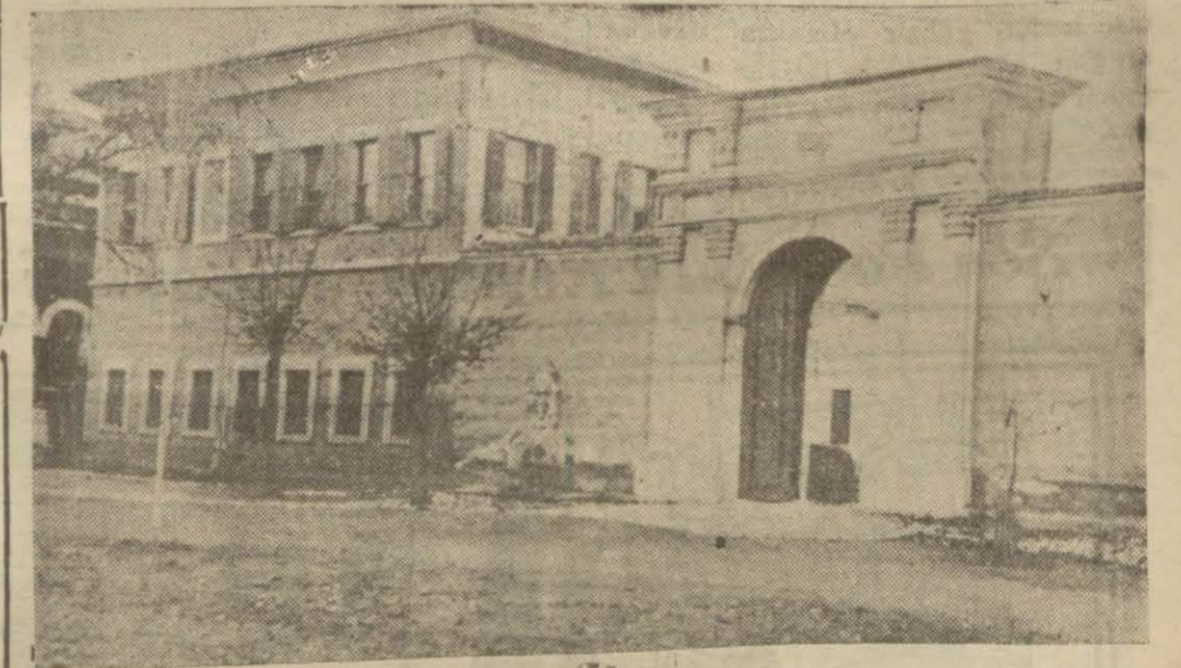
Yeni faaliyete sahne olan Darphane binası

Aydın, 24 (A. A.) — Dün 17,30 da Söke - Aydın yolunda feci bir otomobil kazası olmuştur. Sökeden Aydına hareket eden, Aydın Belediyesine kayıtlı (30) kişilik bir otobüs Sökeden iki kilometre mesafede bir hayvana çarpmak suretile kapaklanarak devrilmiştir. Bir ölü ile dokuz ağır olmak üzere (31) yaralı vardır. Şoförün bir gözü kör olmuş ve hastaneye kaldırılmıştır.