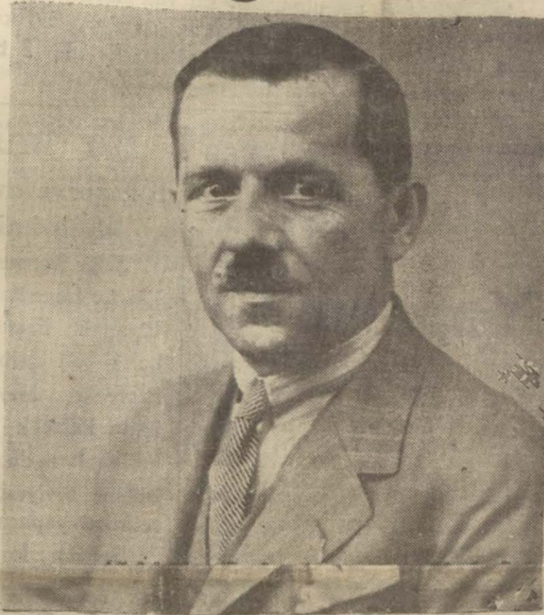
Adliye makinemizin sağlamlığını temine gayret eden Adliye Vekili Saraçoğlu Şükrü Bey

Bundan başka Tayyare Cemiyeti tabettirmiş mimum evraktan, bu meyanda noter ve icra dairelerinden mahkeme evrakından evlenme cüzdanlarından az nisbette tayyare res-